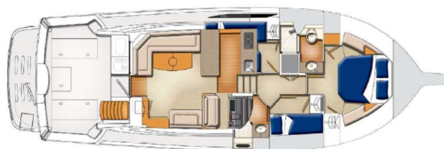
Lower helm option