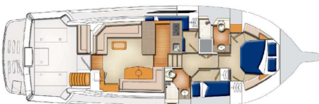
Cockpit barbecue and mezzanine option